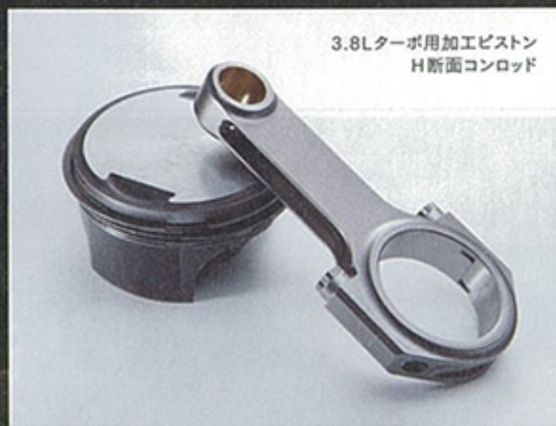
3.8Lターボ用加工ピストン H断面コンロッド