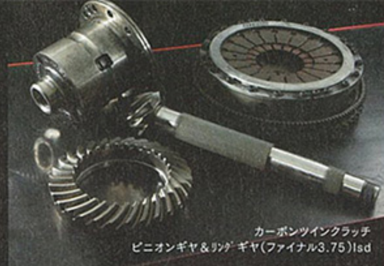
カーボンツインクラッチ ピニオンギヤ&リングギヤ(ファイナル3.75)1sd