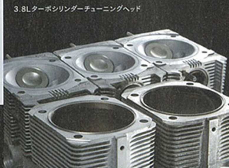
3.8Lターボシリンダーチューニングヘッド